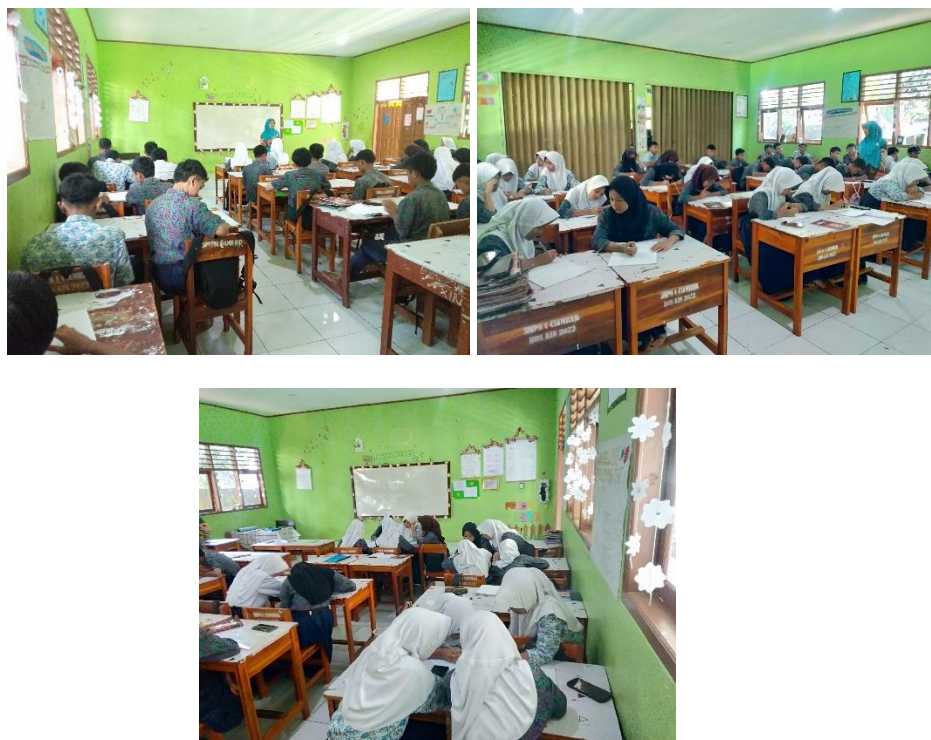
Gambar 1. Kegiatan Pembelajaran

Segala sesuatu harus ditujukan pada perkembangan siswa, bukan pada kepuasan diri sendiri guru dan pihak berkepentingan lainnya. Ketika siswa menggunakan LKPD untuk meningkatkan aktivitas belajarnya, maka siswa akan semakin ingin tahu terhadap apa yang diajarkan, sehingga siswa akan lebih mudah merasa ingin tahu dan fokus terhadap apa yang dipelajarinya. Semakin penasaran siswa, secara tidak sadar mereka akan semakin fokus pada proses pembelajaran (Kemendiknas, 2010) (Sasomo & Faizatul, 2024). Peneliti mengamati bahwa dalam pembelajaran siswa terdorong aktif dalam diskusi kelompok dalam kelas, ini cukup efektif untuk meningkatkan minat belajar siswa.